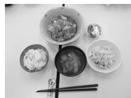
4月8日の夕食会の様子とメニュー：カレー肉じゃが