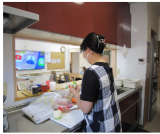
高齢者施設で夕食の準備