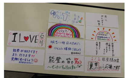
小学生向け特別メニュー 能登半島地震の被災地にメッセージを送りました！