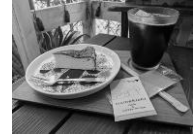
人気のチーズケーキ

日 時：4月24日（金）13：25ウエルカム集合（ちょこバス13：38市役所発） 雨天中止