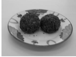
もちもちのおはぎが できました