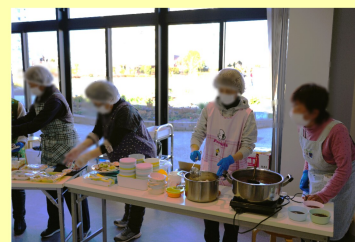
ボランティアの 皆さま→