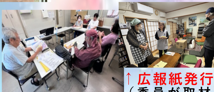
↑ 広報紙発行 (委員が取材)