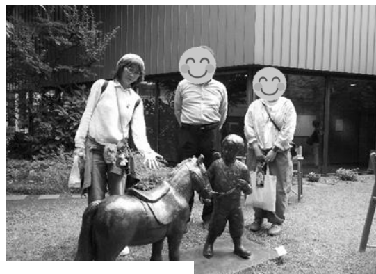
【ちひろ美術館前とちひろの庭で撮影】