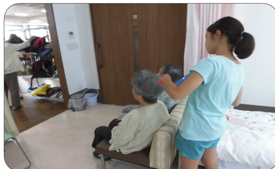
利用者さんの頭を乾かしている様子