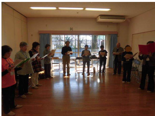
声が出たら、歓喜の声があがります

くと、声帯が弱ってきます。群読には、腹式呼吸ができるようになったり、脳が刺激され、滑舌が良くなる等の効果があります」と話します。