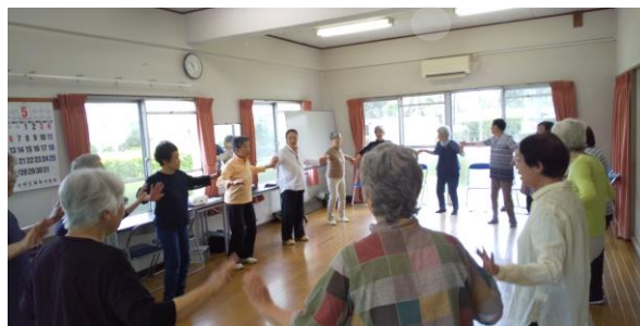
サザエさんの曲に合わせて踊ります

サロンを通じて別の階段を使う人ともあいさつをするようになり、今では食事に行くこともあるそうです。