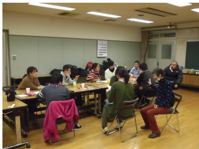
皆さんでお話している様子

さて、夏本番を迎え、照り付ける日差しが痛いほどになりました。暑さが苦手な私は、「暑さ対策と熱中症対策は万全にしないと」と意気込んでいます。みなさん、おすすめの対策がありましたら、ぜひ教えてください。一緒に夏を乗り切りましょう！（高野）(P2の答え：栄公園（南街）「へびのすてっき」)