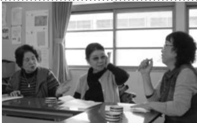
仲間とおしゃべりにこぼれる笑顔

また、このサロンから派生した活動として、独自の歩こう会や自彊術、新年会や初詣などもあります。またサロンで制作した作品を自治会のお祭りで展示するなど、地域の伝統とも融合した活動を展開しています。春には花を愛で、夏には涼を求め、秋には色づく紅葉を楽しむ。参加者の発想により季節ごとの楽しみも盛りだくさんです。男性の参加者が多いのもこのサロンの特徴。男性の積極的な参加と地域づくりへの熱意、住んでいる街への愛着が伝わってきます。