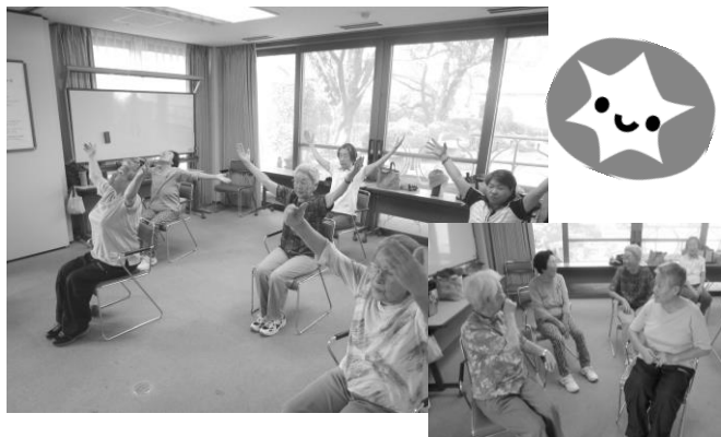
音楽に合わせて体を動かす