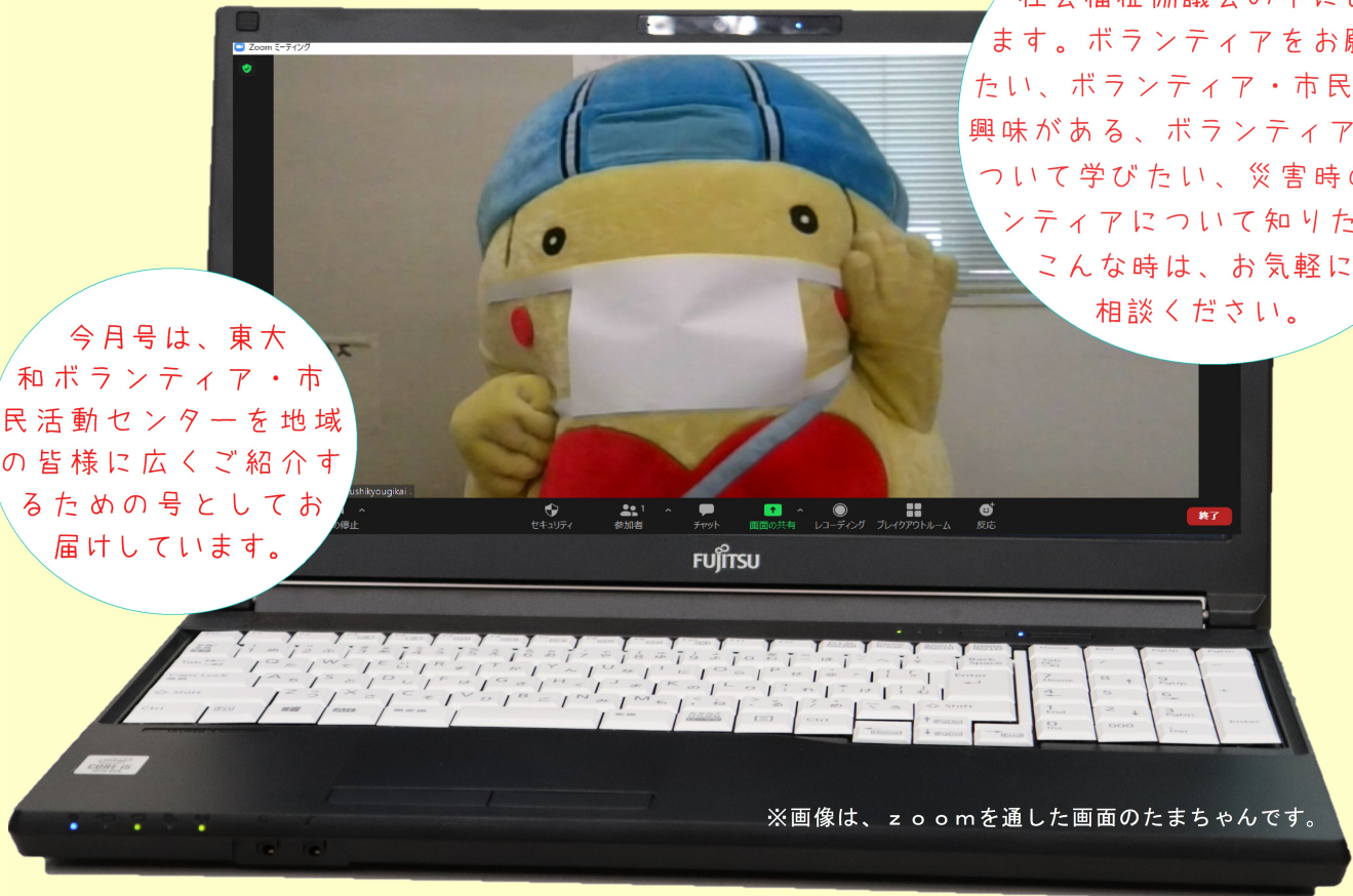
※画像は、zoomを通した画面のたまちゃんです。

今月号は、東大和ボランティア・市民活動センターを地域の皆様に広くご紹介するための号としてお届けしています。