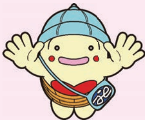
「しゃきょうのたまちゃん」