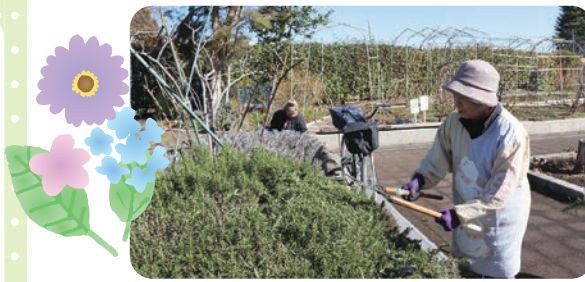
ローズマリーの剪定作業