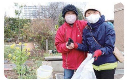
みんなで楽しく活動しています