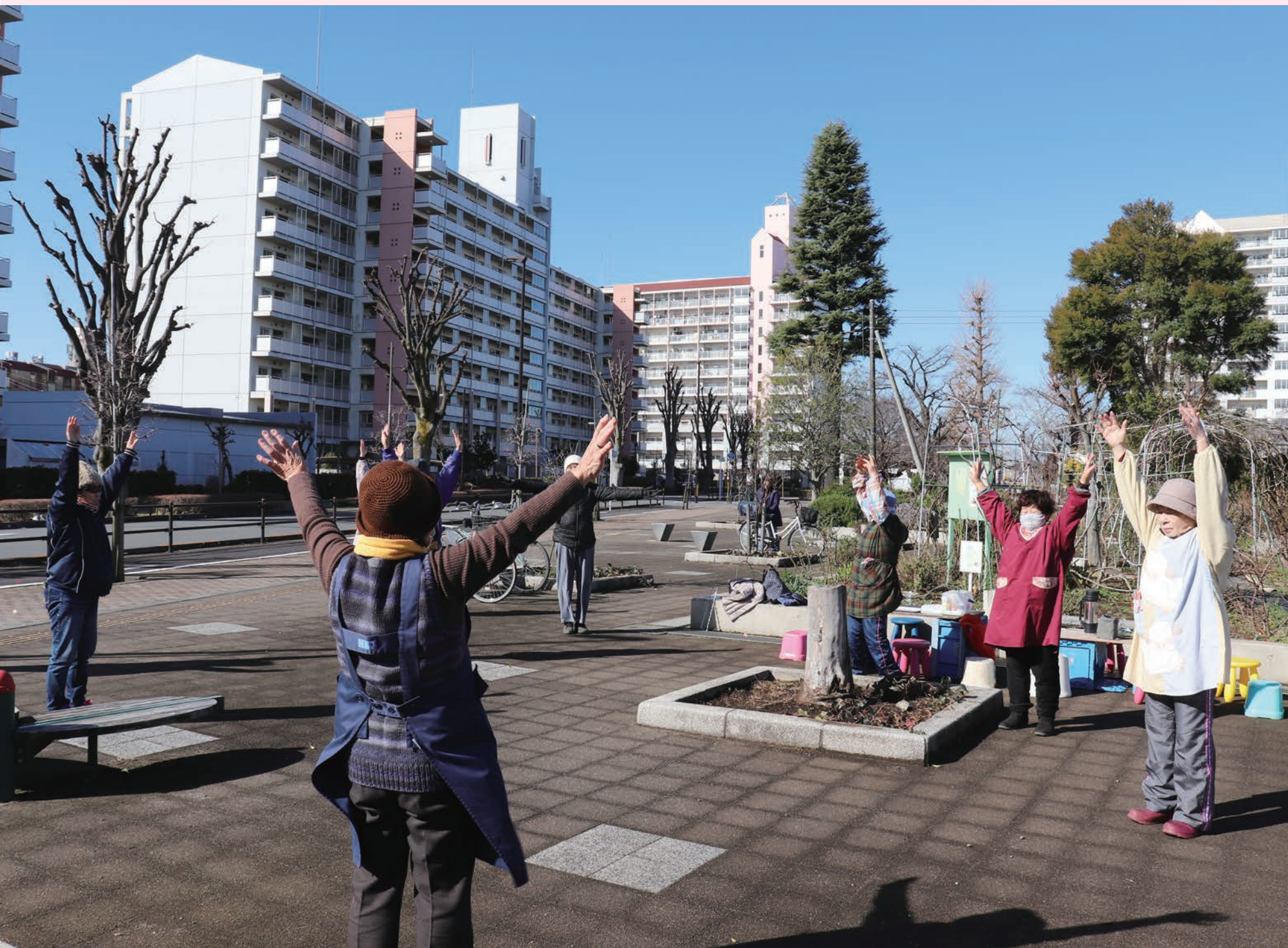
体操をする様子(園芸サロンなでしこ)