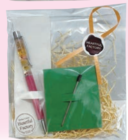
作業所製品(一例です)