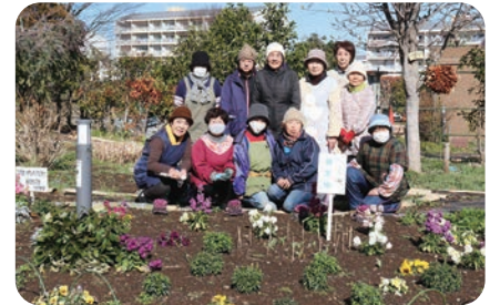
向原中央公園の花壇を担当しています